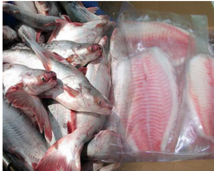
Unas 44 toneladas de tilapia y panga de China y Vietnam serán destruidas por estar contaminadas con la bacteria del cólera.