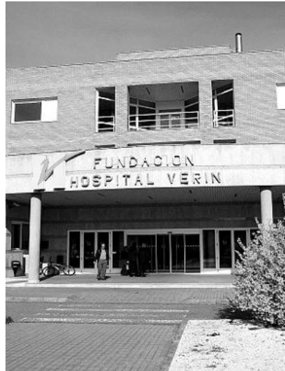
Vista del Hospital de Verín Jesús Regal

El pez panga una especie de acuicultura poco nutritiva se cultiva en el río Mekong, en Vietnam, un curso fluvial muy contaminado. En un análisis realizado este verano por el laboratorio Anfac-Cecopesca, confirmó la presencia de patógenos, entre ellos listeria y cólera y diversos lotes de este pescado comercializados en Galicia.