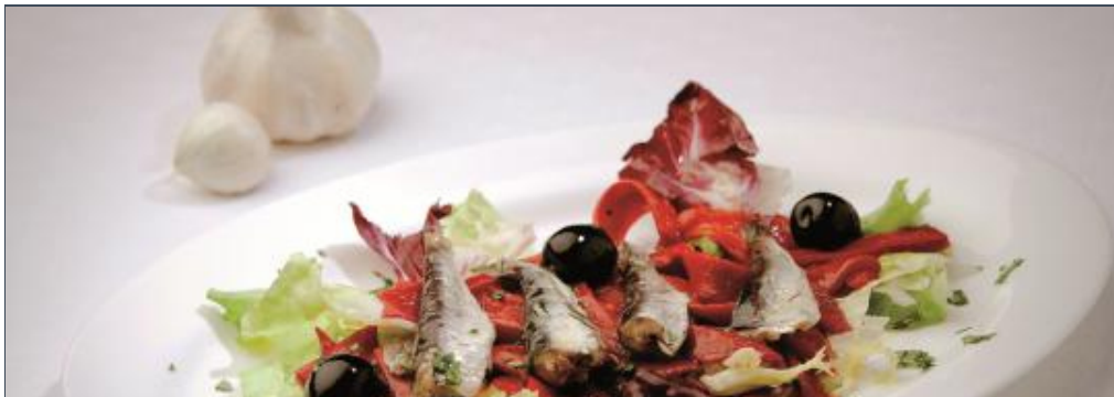
Sardinas pescadeRías con ensalada tibia